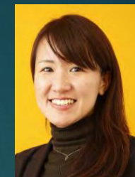
自社の働き方 変革リーダー