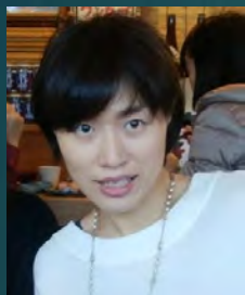
産業医業務サービス 会社 OHコンシェルジュ