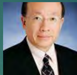
人と場へのFM投資 価値研究部会部会長

(オフィス・ワークプ レイスの知的生産性研 究部会 FMプロジェクトマネジ メント研究部会)