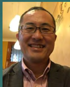
人と場へのFM投 資価値研究部会 副部会長