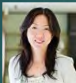
オフィス・ワーク プレイスの知的生 産性研究部会長