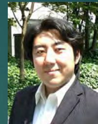
FMプロジェクト マネジメント 研究部会長