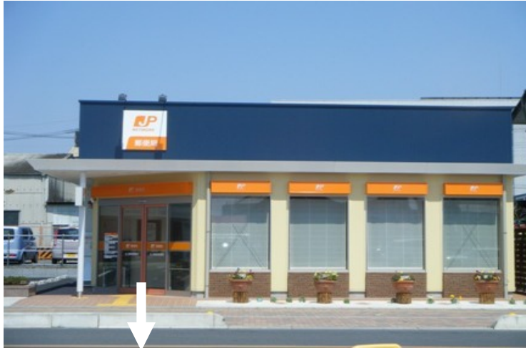
○2010年(H22年) 60歳 北上尾郵便局 埼玉県