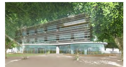
中央図書館の改築