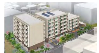
区営住宅の再編整備