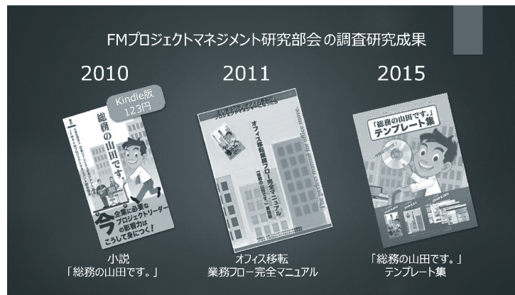
図表3 これまでの調査研究成果

ワークスペースを第四の経営基盤とした企業のFM向上に寄与することを目的とし、インハウスと外部PMサービス提供者（50：50）の幅広い知見で調査研究を行い、養成普及に努める。最新のFMプロジェクトマネジメント動向に関する情報交換や、日々の業務課題の相互相談などを行っており随時部会員を募集しているのでご関心のある方はぜひ参加をお勧めする。◀