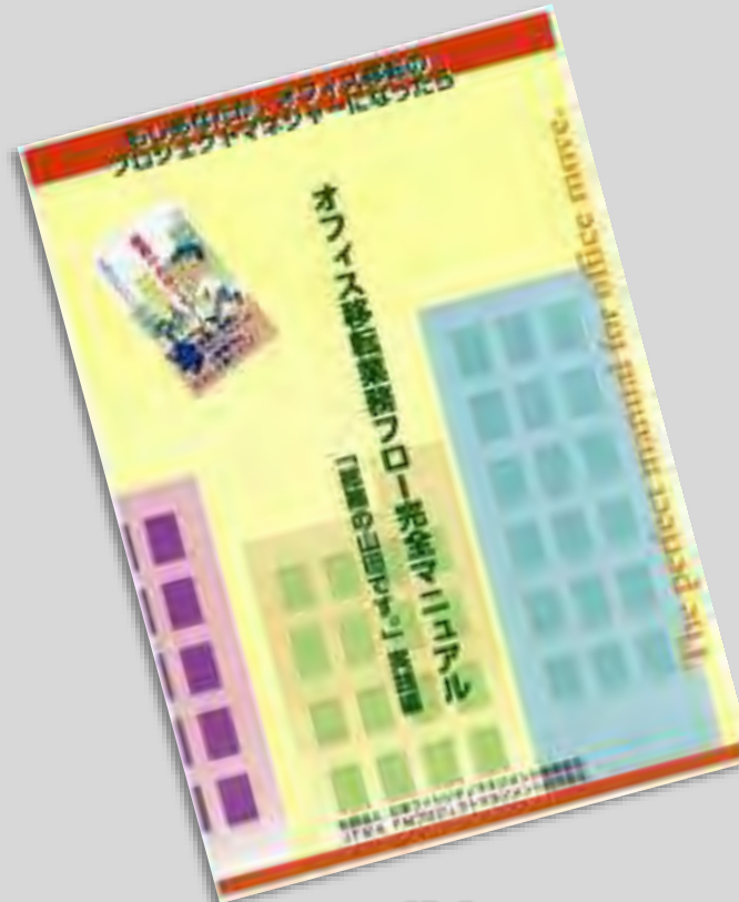
オフィス移転 業務フロー完全マニュアル