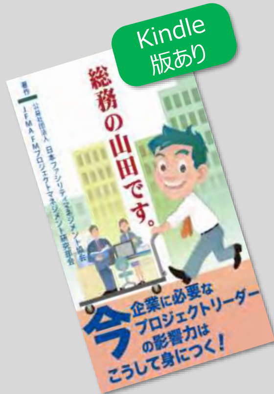
小説 「総務の山田です。」