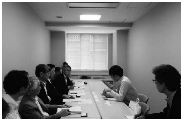
写真 1 保全分科会の取材風景

これら訪問先のうち東京学芸大学での保全業務について紹介する。2006 年度より導入されたもので、「直し救急隊」と呼ばれる内容である。日々発生する小修繕への要望、対応時間の短縮などを目的として契約仕様の中に『緊急障害時の対応』を規定し、日々の小修繕は委託先であるビル管理企業が実施している。通常、構内で発生する小修繕は施設の担当者が窓口となり、その初期状況を確認していることが多く、不定期な電話対応、呼出、現場確認などに追われることも多い。そうした不定期な対応を仕様内で規定し、処理可能なものは管理企業が修理を行う。管理企業で処理できないものが施設担当者へ報告され、予算化、修繕対応となる。管理企業の対応と施設担当者が行う内容を明確に決めている事例は先駆的であるといえる。これにより施設担当者は不定期な呼出、急な対応、小修繕への要望などを受け付ける時間から解放され、本来の業務である施設戦略、修繕計画立案と実行に注力できる。これは発注者である大学施設課と委託先である管理企業がその役割に応じてルールを決めて業務