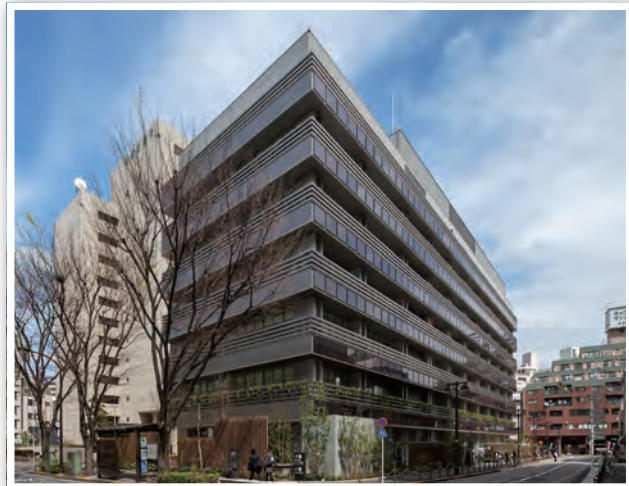
最優秀FM賞（錦澤賞） 東京都板橋区

ファシリティマネジメント(FM)は、人事、財務、ICTとともに コアビジネスを推進する重要な経営基盤です。