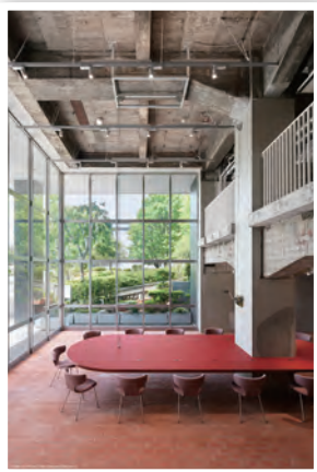
優秀FM賞 株式会社リクルート