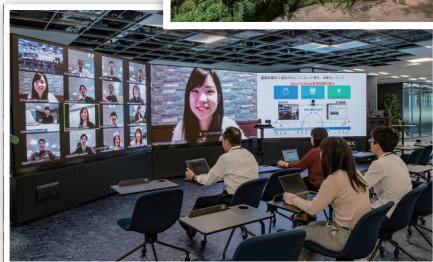
優秀FM賞 NECネットエスアイ 株式会社