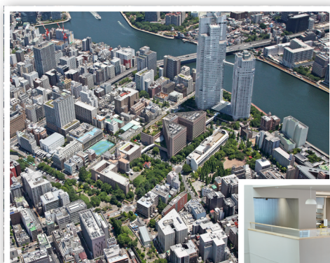
最優秀FM賞(鶴澤賞) 学校法人 聖路加国際大学

ファシリティマネジメント(FM)は、人事、財務、ICTとともにコアビジネスを推進する重要な経営基盤です。これを第四の経営基盤と呼び、ワークスペースやCRE(企業不動産)、さらにインフラやサービス等、それらが、人に、組織に、社会にいかにか寄与しているかを評価するのが日本ファシリティマネジメント大賞です。みなさまの実践事例はこれからのFMのベストプラクティスとなることでしょう。ご応募をお待ちしています。