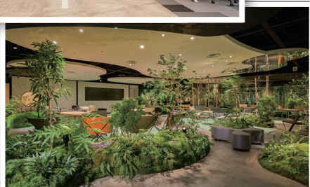
優秀FM賞 株式会社 資生堂