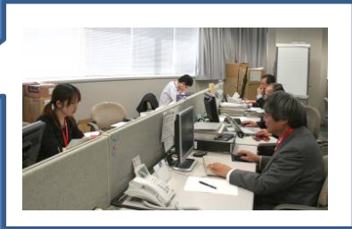
赤羽本社オフィスは島型配席