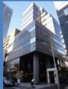
カルネコオフィス