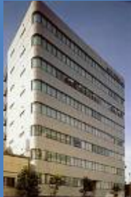
ジャパンフリトレ 東上野オフィス