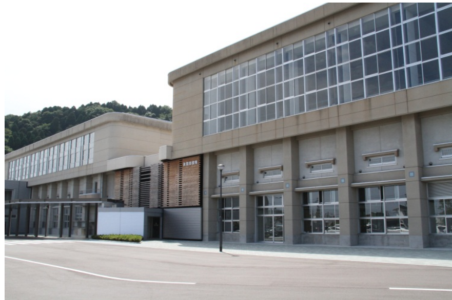
氷見市役所本庁舎 (平成26年5月開庁)