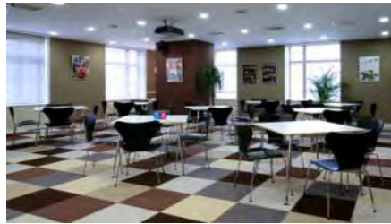
マルチパーパスエリア「M-Café」